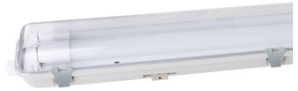
↑ Grapas metálicas Metal staples Grampos de metal